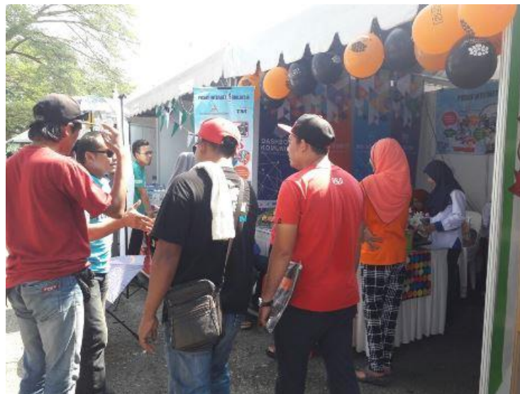
Pengunjung yang hadir di Booth Pi1m-Taklimat dari Petugas mengenai Dashboard dan Produk Pi1m