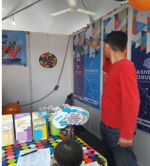
Permainan Baling Dat Di Booth PiIm oleh pengunjung