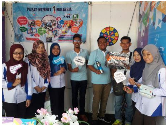
Petugas piIm dan pemenang yang bertuah