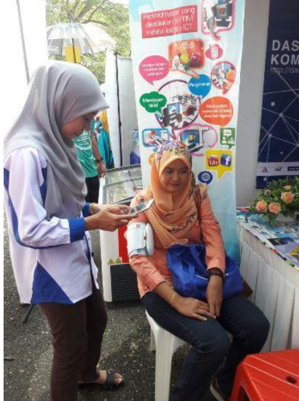
Petugas membuat pemeriksaan Kesehatan di Booth (I-Health)