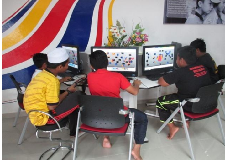
Permainan pendidikan puzzle online