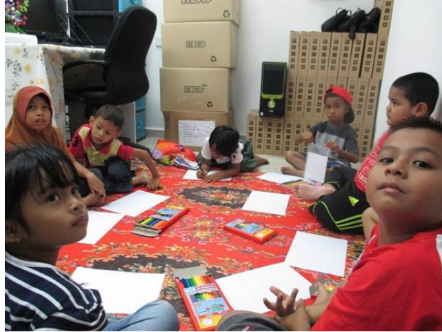
Aktiviti mewarna kanak-kanak