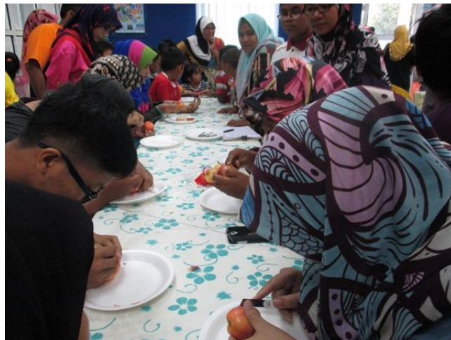
Aktiviti mengukir Buah epal