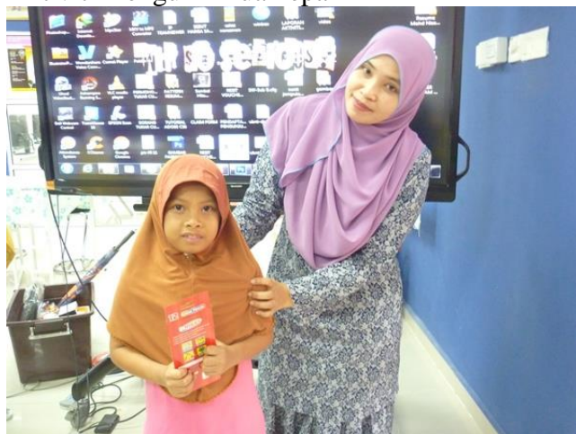
Penyampaian Hadiah dan cenderahati