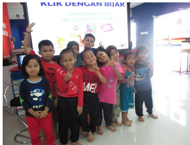
Gambar selesai program Kdb