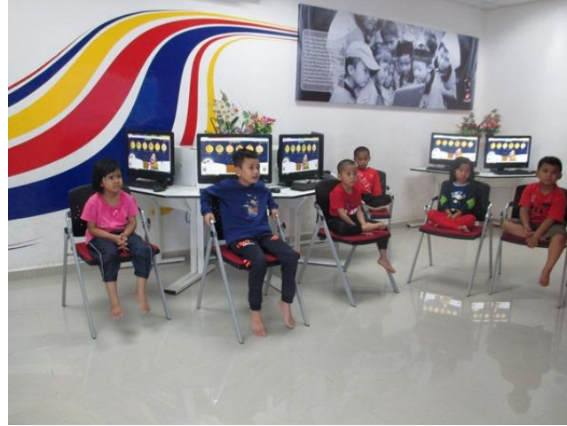
Taklimat Kdb Kepada pelajar yang hadir