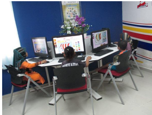
Aktiviti mewarna online