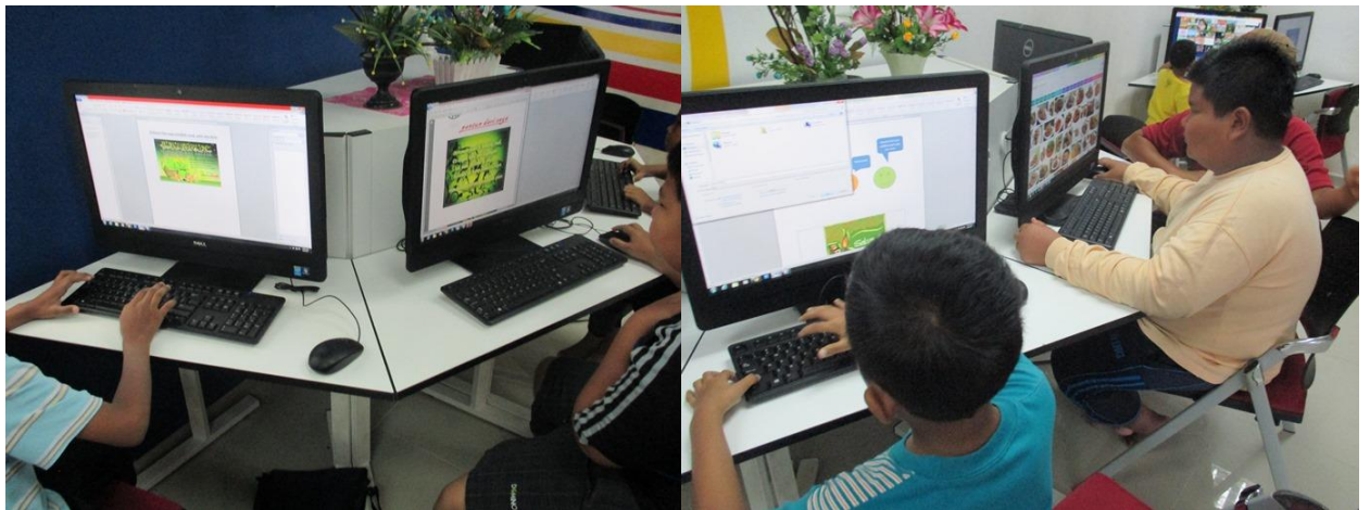
Caption : Kelas sedang dijalankan

iii) Bengkel Latihan ICT/ Keusahawan yang dihadiri